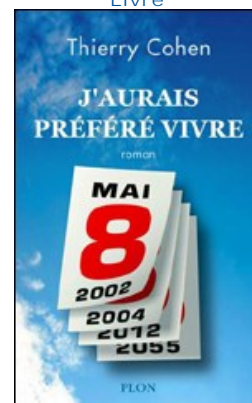
Thierry Cohen J'aurais préféré vivre En savoir plus >>>